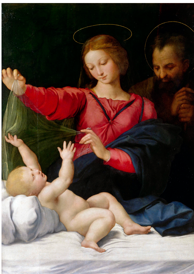
Raphael, la Madone de Lorette